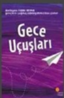
Gece Uçuşları İshak Reyna