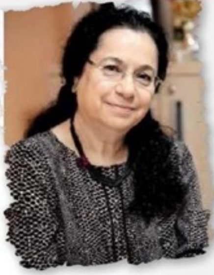
KİTAP İYİ GELİR MÜREN BEYKAN