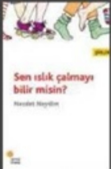
Necdet Neydim, Sen ıslık Çalmayı...