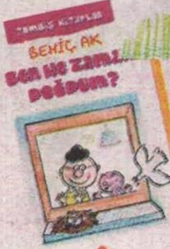
Ben Ne Zaman Doğdum Behiç Ak Günüşiği Kitaplığı 14 TL

her an hayatında. Bu durum çocukların okuma alışkanlığı kazanmasına sizce nasıl etkiliyor?