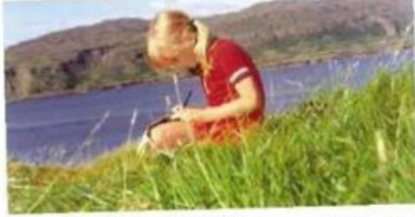
Cressida Cowell küçükken yaz tatillerini geçirdiği adada ilk hikâyelerini yazarken.

Aslında Londra'da büyüdüm, fakat çocukluğumun büyük bir kısmını, özellikle yaz tatillerini, İskoçya'nın batı kıyısındaki ıssız bir adada geçirdim. Adada ne yol, ne ev,