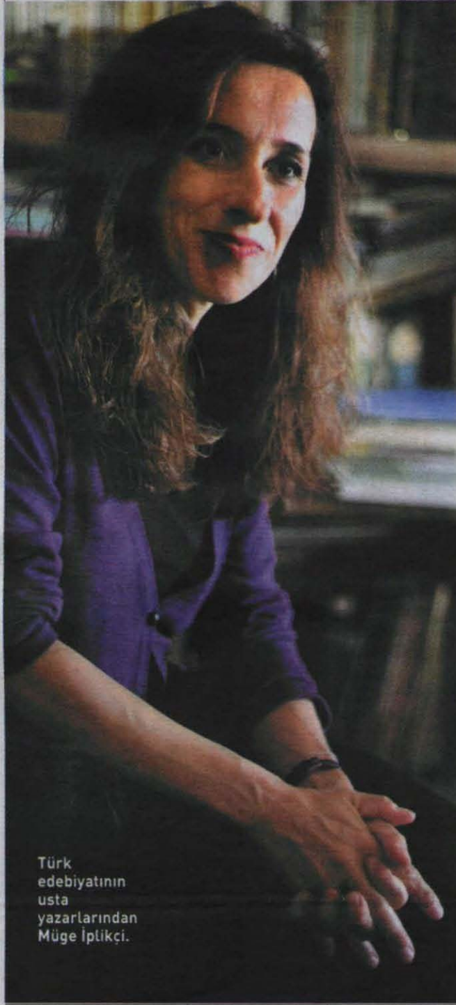
Türk edebiyatının usta yazarlarından Müge İplikçi.

“ H erkes hayal kurar. Ama her zaman kurar mı? Sonra da, olamı olmayanla karıştırır mı? Bunun üzerine masallar anlatır mı? Diyelim ki anlattı, sonra döner buna inanır mı? Sibel biraz böyle bir kızdı işte. Öğretmeni onun ilerde iyi bir yazar olacağını düşünüyordu. Ama Sibel bunu fazlasıyla sıkıcı buluyordu. Ne o öyle masa başında, bilgisayar önünde ya da kalem kâğıtla saatlerce boğuş dur!”