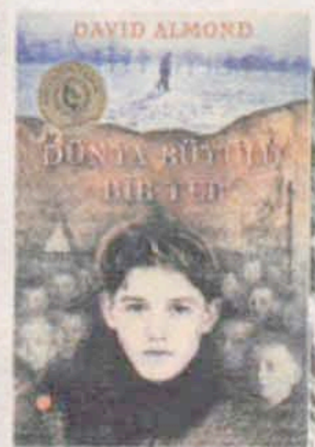
Dünya Büyülü Bir Yer David Almond Çev: Mine Kazmaoğlu Güneşçi Kitaplığı 14 TL