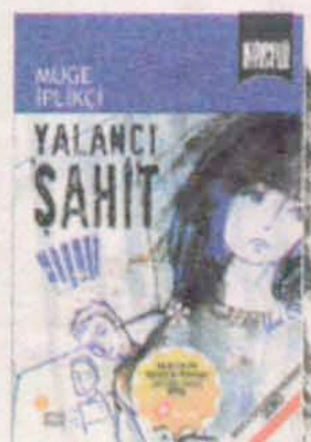
Yalancı Şahit Müge İplikçi Güneşçi Kitaplığı 13 TL