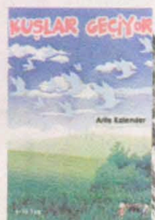
Kuşlar Geçiyor Arife Kalender Bizce Kitap 8 TL